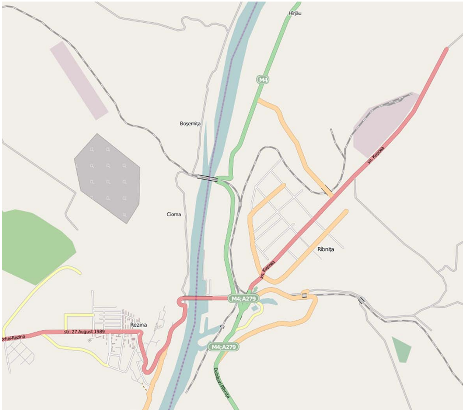
Rybnitsa and Rezina in 2010