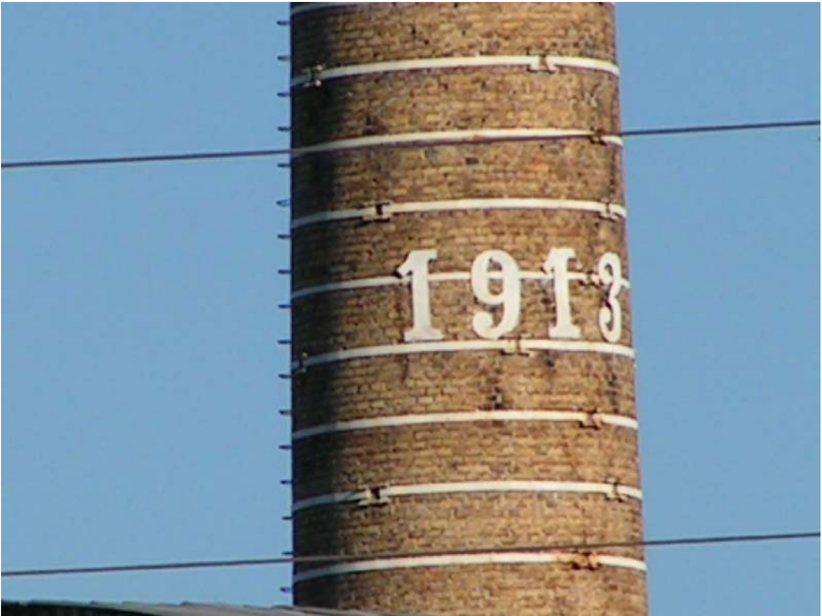
The enigmatic year "1913"

Lorem ipsum dolor sit amet, consectetur adipiscing elit. Aenean mattis, tortor egetas pellentesque condimentum, magna nunc lobortis nunc, ut blandit metus nibh in erat. Fusce magna dolor, luctus ac vestibulum et, ultricies id sapien. In hac habitasse platea dictumst. Praesent convallis velit vel metus auctor laoreet. Donec fringilla mi in dolor laoreet aliquam. Suspendisse arcu tortor, bibendum eget hendrerit sed, cursus sit amet enim. Aenean quis dolor sed metus mollis eleifend ac fermentum leo. Donec aliquet placerat mauris vel tristique. Sed sapien mauris, pulvinar et congue eu, semper nec nisi. Praesent feugiat lectus ac turpis pretium eleifend. Curabitur eget turpis id neque posuere feugiat a cursus dolor. Duis nibh tellus, pretium eget ornare vitae, commodo non nibh. Mauris pharetra elit vel mi auctor nec euismod elit pharetra. Phasellus aliquet nibh et ligula interdum aliquet eu nec augue. Sed sit amet sodales nisi. In dolor sem, euismod ac laoreet et, ultricies elementum orci.