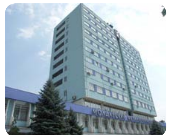
Moldova Steel Works