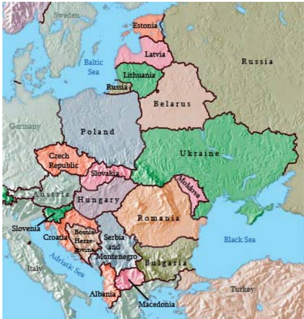
Eastern Europe (2010)

Pellentesque eget nunc metus. Duis condimentum faucibus sodales. Etiam metus velit, pellentesque pharetra auctor sodales, rhoncus a arcu. Praesent at magna quam. Fusce interdum orci in diam facilisis placerat vel eu velit. Curabitur tincidunt elementum scelerisque. Phasellus ut augue nulla. Donec varius dapibus tortor accumsan eleifend. Donec est augue, vehicula et tristique ut, rhoncus et est. Maecenas et ligula in mi posuere dignissim. Nam ut ultricies velit. Donec tempor, quam vel vestibulum pharetra, elit est ornare erat, vel commodo quam turpis ut libero.